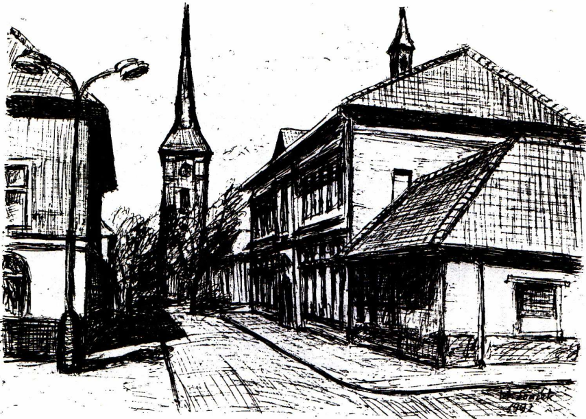
A gimnázium első épülete