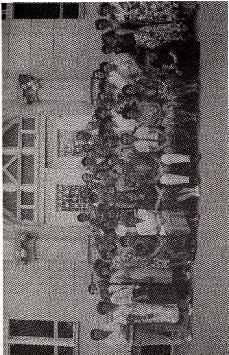
A tanári kar a 150. jubileum évében